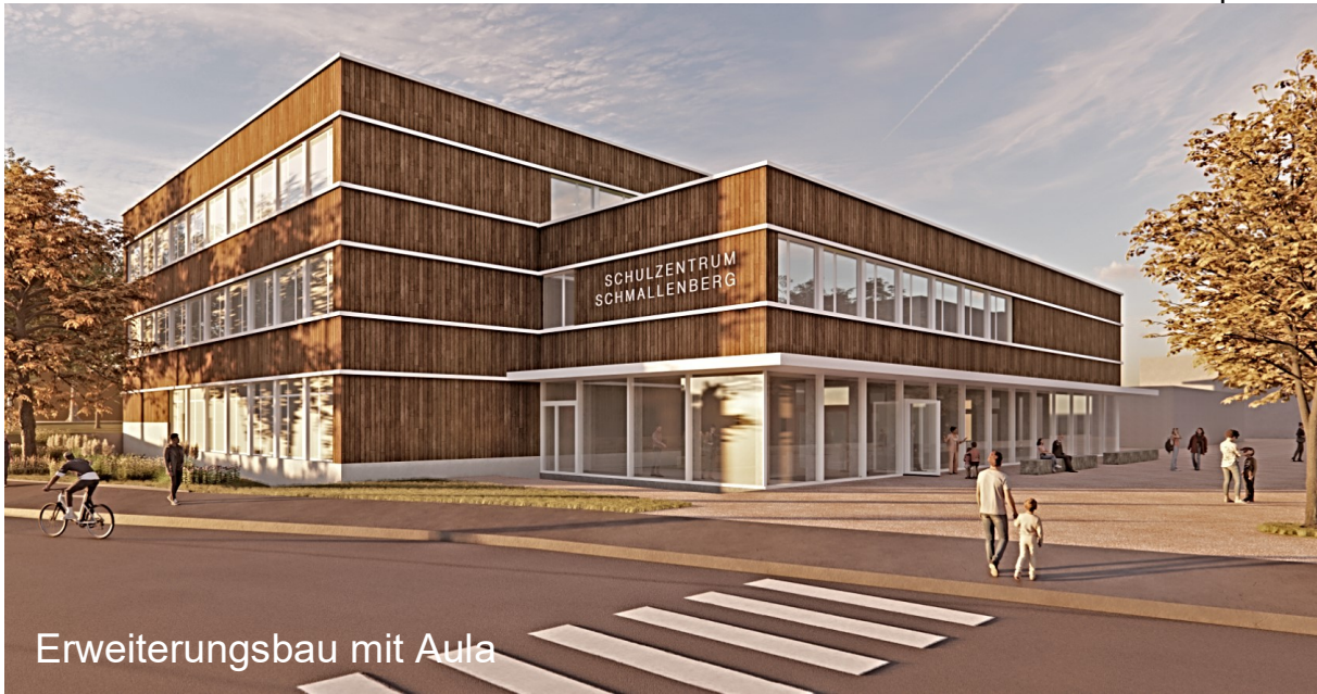
Erweiterungsbau mit Aula